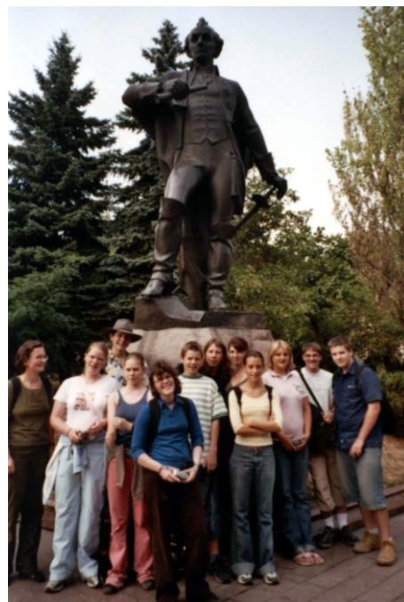
Schüleraustausch in Simferopol, September 2005

Besonders gefielen unseren Schülern die sportlichen Aktivitäten: die lange Wanderung im Bergmassiv Demerdshi, das Baden am schönsten Strand der Krim oder im Becken eines Wasserfalles, und das Reiten auf einem Reiterhof. Überwältigt waren alle von der sprichwörtlichen östlichen Gastfreundschaft, der üppigen Verköstigung und der fürsorglichen Bemutterung. Den Luxus, der uns geboten wurde, können sich Durchschnittsfamilien nicht leisten, Kaffee- oder Restaurantbesuche sind unerschwinglich, statt Mineralwasser trinkt man abgekochtes Leitungswasser. Im Heidelberg-Zentrum unserer Partnerstadt trafen wir zwei junge Deutsche. Sie renovieren im Auftrag der Aktion