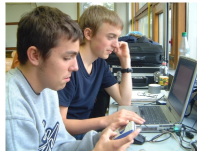
Schneiden der Beiträge mit "Cool Edit"